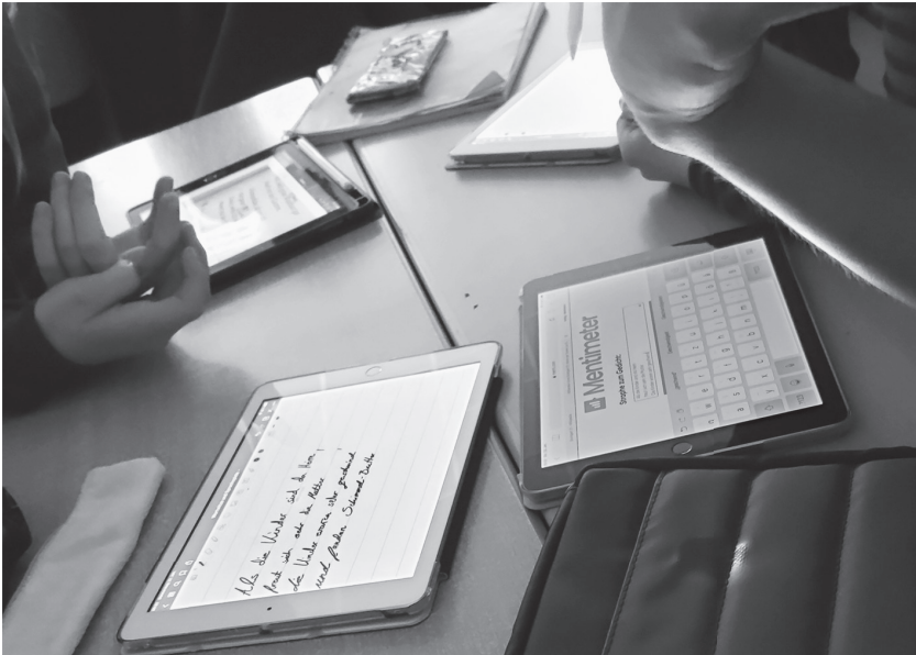
Abb. 4: Schüler*innentische mit iPads und Schreibmaterialien während einer Gruppenarbeitsphase

Den Fokus sollen im Folgenden die letzten beiden Abbildungen bilden: Der Lehrer macht während seines Rundgangs in der Arbeitsphase bei der Gruppe der vier Schülerinnen Halt, erläutert engagiert gestikulierend einzelne Aspekte der von diesen gedichteten Anschlussstrophe (siehe Abb. 3) und bezieht sich dabei interaktiv auf die schriftliche Aufgabenlösung der Gruppe. Die Schülerinnen geben sich kooperativ und überarbeiten die lehrerseitig kritisierten Aspekte im Anschluss. Hinsichtlich der Dinglichkeitsdimension weisen die digitalen Geräte dabei eine markante Unterschiedslosigkeit zu analogen Arbeitsmitteln auf: Anstelle der Tablets könnten auch Hefte oder Arbeitsblätter auf den Schülerinnentischen liegen. Zwar bilden die vier Tablets gegenüber dem einzelnen Schreibblock das dingliche Zentrum der abgebildeten Interaktionspraxis, allerdings ist dieser qualitative Unterschied kein genuin medial evozierter, sondern durch die in der sozialen Praxis getroffenen Mediennutzungskonventionen hervorgebracht. Es gehört zur unterrichtlichen Anforderungsstruktur und zum „Schülerjob“ (Breidenstein 2006), dass sie ihre Aufgaben schriftlich festhalten, und das heißt in diesem Kontext: digital bearbeiten. Das sinnstrukturelle Zentrum der Situation bildet die pädagogische Interaktion, die Blicke der Schülerinnen (nicht im Bild) sind nicht auf ihre iPads, sondern den Lehrer gerichtet. Die folgende Interaktionssequenz zeigt die Dominanz der interaktiven Dimension: