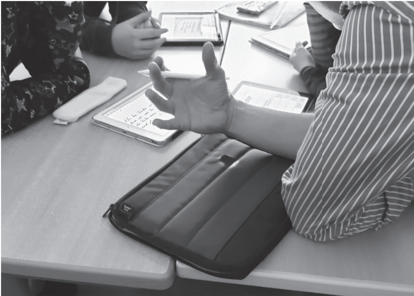
Abb. 3: Schüler*innentische mit iPads und Schreibmaterialien während einer Gruppenarbeitsphase

Am oberen Bildrand sehen wir einen Schreibblock mit Tabletstift, die iPads der vier Schülerinnen liegen in der Tischmitte (siehe Abb. 4). Der erste Bildschirm (links unten) zeigt die handgeschriebene Gedichtstrophe und damit das Ergebnis der Gruppenarbeit, der zweite (links oben) einen Fotoausschnitt des projizierten Arbeitsauftrags, der dritte (rechts oben) ein leeres Textdokument und der vierte (rechts unten) eine Webseite (mentimeter.com), in dessen Textfeld die Gruppe ihre Strophe bereits eingetragen, aber noch nicht abgesendet hat und die im weiteren Unterrichtsverlauf zu einem klassenöffentlichen Votum über die gelungenste Fortführung des Gedichts genutzt werden soll.