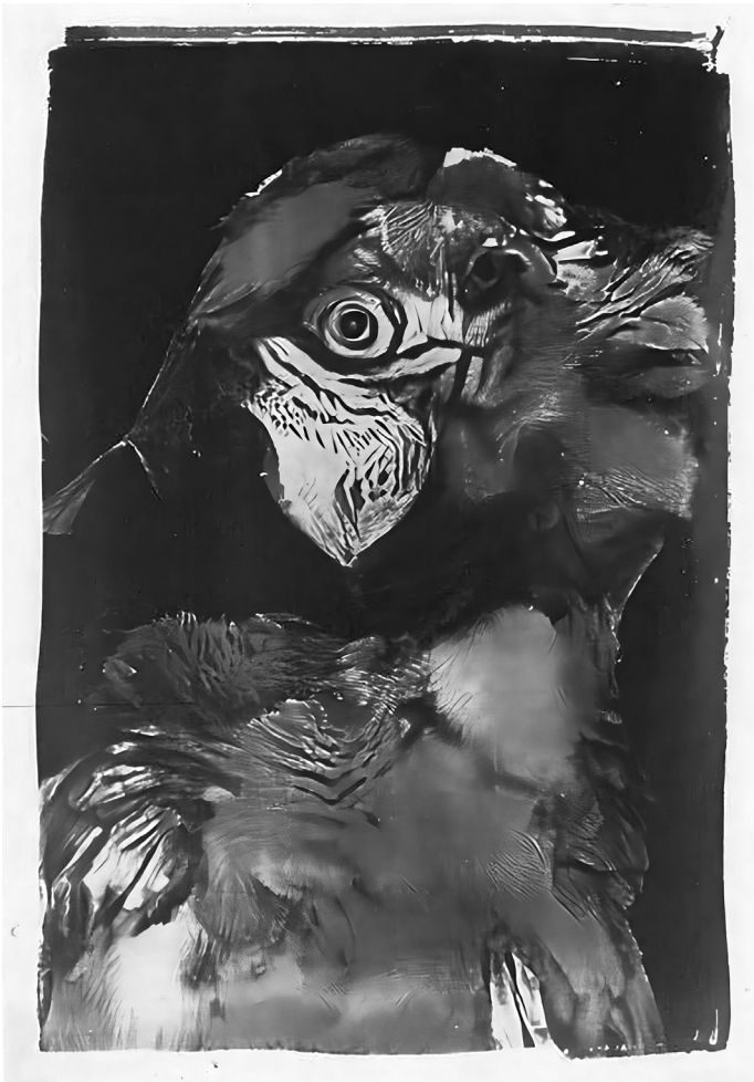
Abb. 1: Sofia Crespo. Neural Zoo ((analog)), 2019–2020, Eisenblaudruck Reihe, Berlin © by Sofia Crespo 2019–2020

Mithilfe maschineller Lernverfahren betreibt sie ein Spiel mit diversen simulierten, aber dennoch vertraut erscheinenden Materialitäten, Texturen und Formen und bildet dabei etwas ab, das seinen Ursprung nicht in der natürlichen Welt hat. Damit lädt sie ihr Publikum zur Erkundung fremder Welten ein und schlägt die Brücke zwischen der menschlichen und einer künstlichen, spekulativen Natur und Artenvielfalt. Indem sie derartige Erfahrungsweisen zugänglich macht, konfrontiert sie gezielt mit den Grenzen menschlicher Wahrnehmung sowie menschlicher Imaginationsfähigkeit.